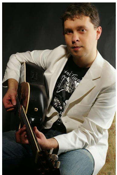
Fotó: Gabor Amadeus