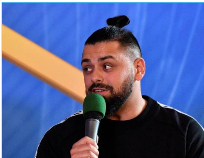
Pápai Joci: jól sikerült a felkészülés az Eurovízióra