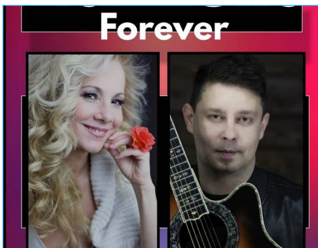
Igazi zenei csemege: PIAZZOLLA FOREVER